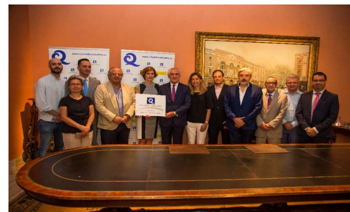
Acto de entrega "Q" de Calidad Turística al Museo Nacional Thyssen